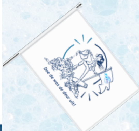
Gevel-vlag (100x70 cm)

* GO PARIS!! De beste PROMO-actie van leden wint een AWARD op 't Jubileumfeest (13 april, 2019) met als hoofdprijs een trip naar Parijs voor het bedrijfsteam (max. 10 pers.) van 19-21 mei! Meer info: netex.nl/laundry-revolution